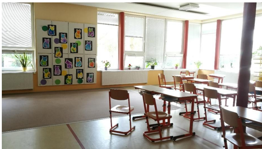
Učebna s bezbariérovým přístupem a speciálně upravenou lavicí s místem i pro asistentku.